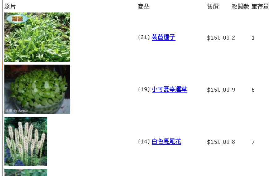
Fig (12) 銷售排行榜