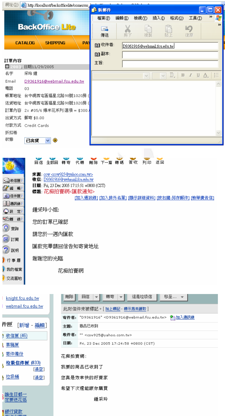
Fig (7) (8) (9) E-mail 通知顧客