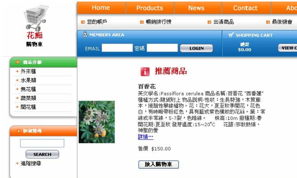
Fig (1) 商品分類