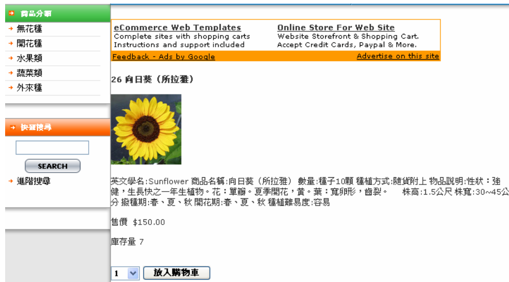
Fig (3) 開花類舉例

3.以開花類的向日葵來舉例，內容有簡單介紹內容，花名、種子數量、種植方式、以及花種的細微介紹，也標明了價錢，讓買主能夠了解詳細內容再決定是否購買。