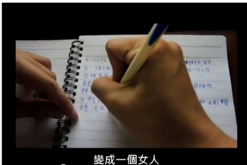
(拍攝小任任努力打工)